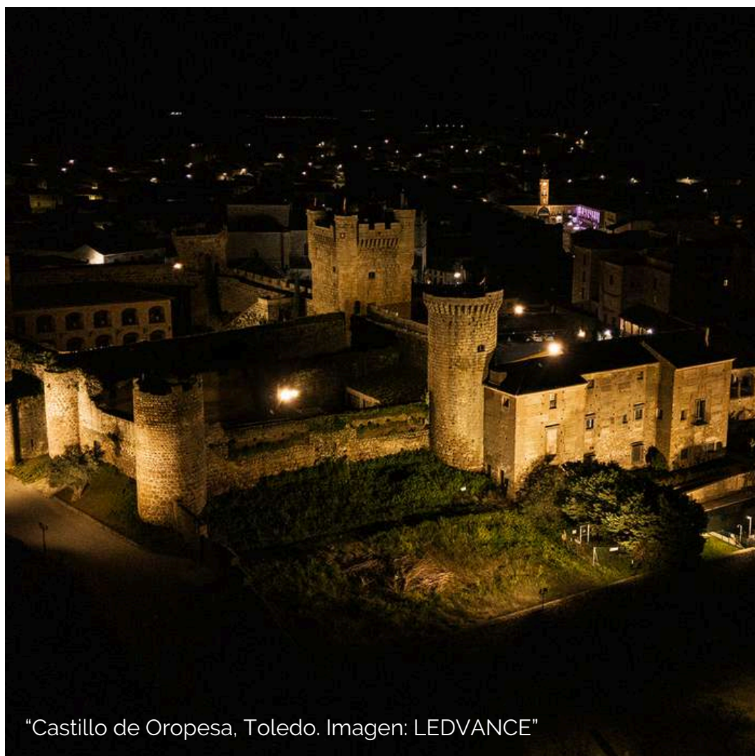
"Castillo de Oropesa, Toledo."