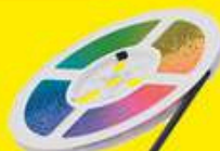
TIRA LED SOLAR AIRE