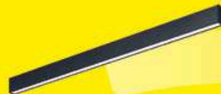
LUMINARIA LINEAL LINA