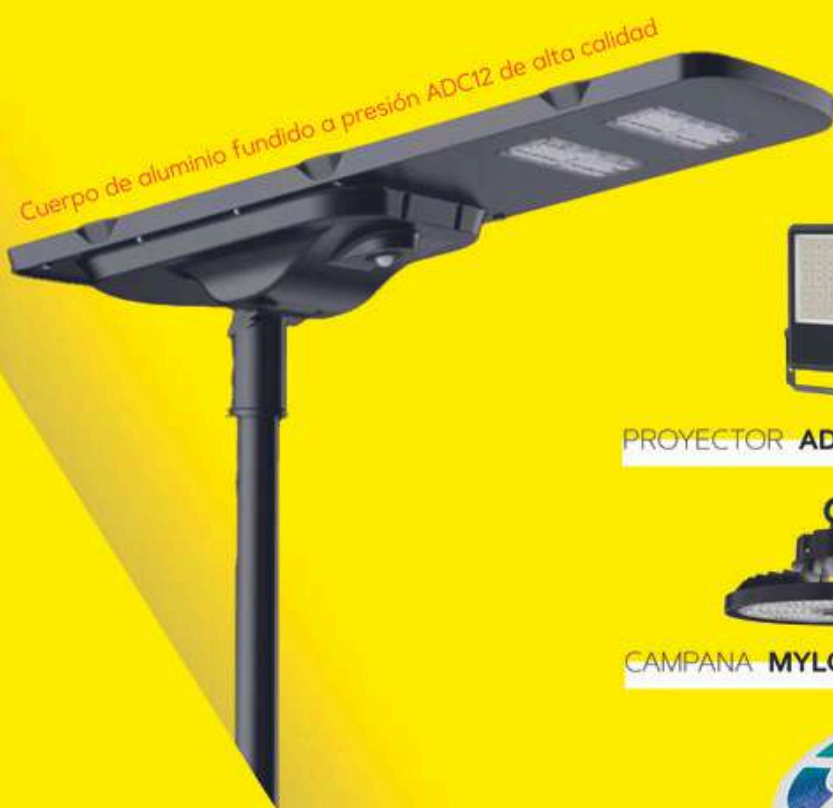
FAROLA SOLAR UMBRA