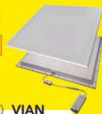
PANEL 60X60 VIAN