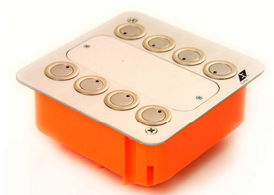
Abb. 2: Seitenansicht Tableau im Hohlwand-Gehäuse

Es ist keine zusätzliche Hilfsspannung erforderlich