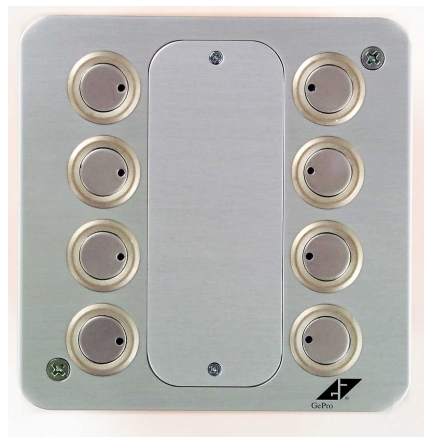
Abb. 1: EIB/KNX-Tableau mit 8 Tastern / LED

Die Frontplatte ist aus Aluminium gefertigt und in der Struktur in eloxiert / natur gearbeitet. Als Bedienelemente finden runde, flache Metalltaster mit integrierter grüner LED Verwendung. Abnehmbare, gravierbare und versenkte Beschriftungsfelder runden das Bild ab.