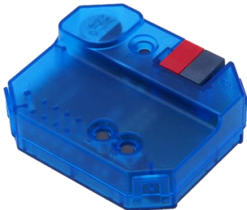
KNX ENO 626 secure

Bi-direktionales Gateway mit 8+8 Funkkanälen zwischen EnOcean und KNX