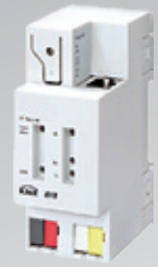
Router KNX IP

Houseinhand® proporciona una total integración bidireccional de las instalaciones KNX con dispositivos iOS de Apple. Houseinhand® se conecta directamente a cualquier instalación KNX mediante una pasarela o router KNX IP, permitiendo una comunicación instantánea con todos los dispositivos KNX desde la casa o fuera de ella, contrariamente a otras soluciones que se basan en servidores.