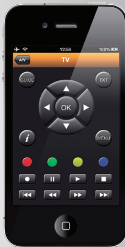
Widget TV (pág. 2)