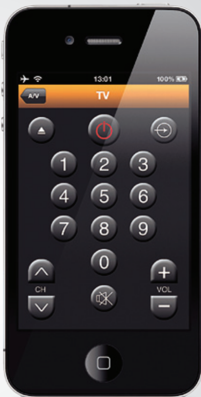
Widget TV (pág. 1)

Todo ello manejado desde una interfaz simple, fiable y elegante.