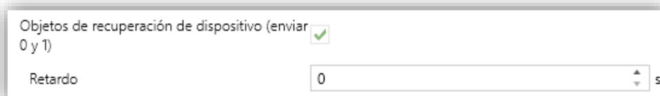
Figura 3 – Objetos de recuperación de dispositivo.

Nota: tras descarga o fallo de bus, el envío se produce con un retardo de hasta 6.35 segundos más el retardo parametrizado, a fin de no saturar el bus.