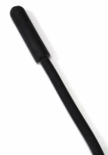
Figura 1. ZACNTCF

1 La longitud total del cable puede ser aumentada teniendo en cuenta las características de la entrada del dispositivo a la que se conecte. Revisar la hoja técnica del dispositivo correspondiente.